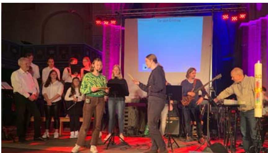
Das Anspiel gehört zum Alex18:30 so wie Musik mit dem Jugendchor.

Für Jugendliche, die sich in der Arbeit mit Kindern und Jugendlichen engagieren, gibt es die Ausbildung zu Jugendleiter*innen. Bundesweite Mindestanforderungen und Landesregelungen legen die Inhalte fest, um nach Durchlaufen der Ausbildung die „Juleica“ beantragen zu können. Zusätzlich hat die Evangelische Jugend Inhalte festgelegt, die die Teilnehmenden befähigen, ihre ehrenamtliche Arbeit in den Kirchengemeinden und der kirchlichen Jugendarbeit verantwortlich zu gestalten.