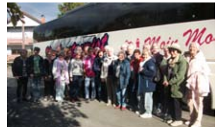
Lauter zufriedene Gesichter bei der Städtetour.