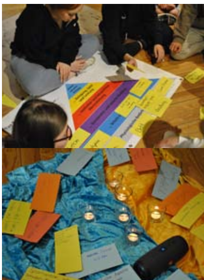
Verschiedene Themen wurden bei der Juleicaschulung bearbeitet.

Die Schulung ist in zwei Blöcke aufgeteilt, JS1 und JS2, und findet jeweils in den Herbstferien statt: Schwerpunkte in JS1 sind u.a. pädagogische Themen wie Gruppenphase, Leitungsstile, Jugendschutz und Aufsichtspflicht, Auftreten und Präsenz, sowie Spielpädagogik. Dazu kommen noch religionspädagogische Themen, biblische Vormittage sowie die Vorbereitung und Durchführung einer Andacht für die gesamte Schulungsgruppe. Schwerpunkte in der JS2 sind u.a. die Vertiefung der pädagogischen Themen wie Leitungsverhalten und die Reflexion des eigenen Verhaltens, Entwicklungspsychologie und Rollenverhalten, Kindeswohl und Prävention sowie Datenschutz und spezielle Rechtsfragen. Umrahmt werden die Schulungstage von gemeinsamen Andachten, Gemeinschaftsaktionen und verschiedenen Kreativ-Workshops an den Abenden. Knapp 80 Teilnehmende und 20 Teamer*innen waren 5 Tage in den Herbstferien im Blockhaus Ahlhorn.