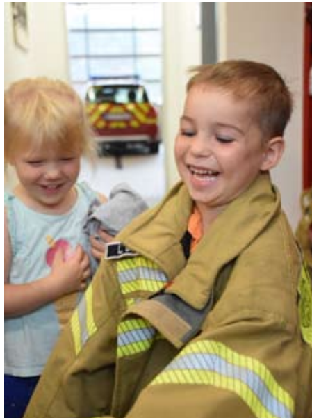
Die Wale-Gruppe hatte sichtlich Spaß bei ihrem Feuerwehrbesuch und hat eine Menge erfahren!