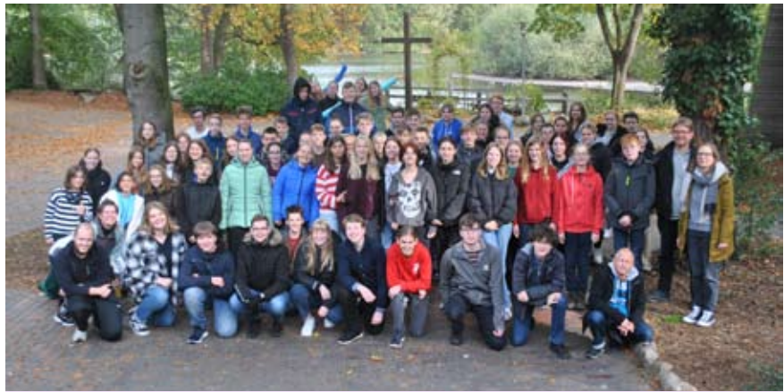
Die Teilnehmer*innen der Juleicaschulung im Blockhaus Ahlhorn

Ein Jahr 2022 so wie immer, so wie die Jahre vor Corona? Dazu ein klares JEIN von mir. Rückblickend weiß ich genau,