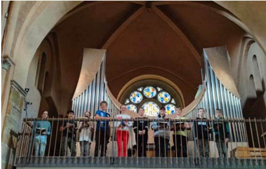
Kinder und Jugendliche interessieren sich für die neue Orgel.