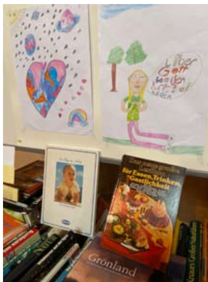
Gegensätze: Auf dem Bild oben die Angst der Kinder vor dem Krieg – darunter die hiesigen Freuden und Genüsse des Lebens

Der diesjährige Bücherflohmarkt stand erstmals unter einem Motto, nämlich „Glaube, Hoffnung, Liebe“. Diese Neuerung ist sehr gut angekommen, nicht zuletzt deshalb, weil die Kinder der Holbeinschule – Klassen 1, 2 und 3c – mit Unterstützung durch Katja Jöllenbeck und Nina Deeken, diese Botschaft mit ihren Bildern aus Kindersicht eindrucksvoll kommuniziert haben (siehe Fotos). Die Idee mit den Stellwänden auf den Tischen zwecks Bilderausstellung hat sich jedoch nicht bewährt, für ähnliche Vorhaben hat der PL inzwischen eine bessere Lösung.