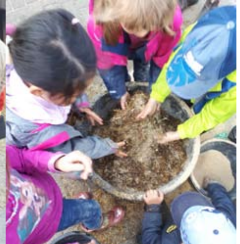
Zu Besuch auf dem Bauernhof - ein spannender Ausflug für die Bärengruppe der Schatzinsel!