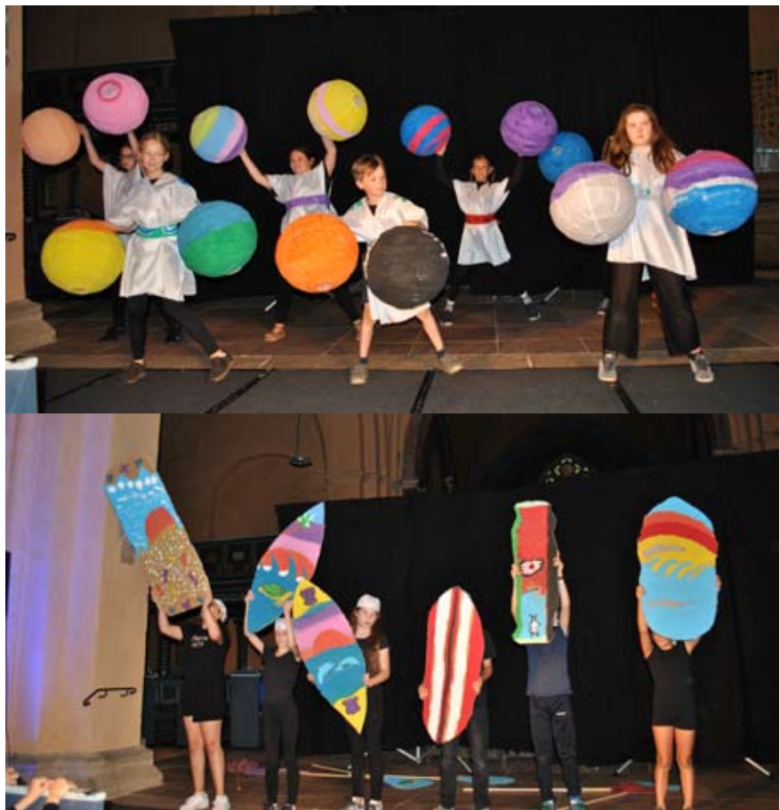
Oben: Choreographie mit Lampions aus dem asiatischen Raum Unten: Waghalsige Manöver mit Wakeboards aus Amerika

Die nächste Schulung findet vom 16. – 21. Oktober statt. Anmeldungen liegen aus oder können angefordert werden.