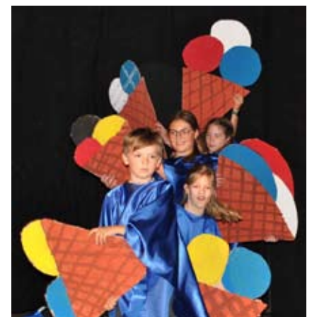
Die europäischen Teilnehmer*innen präsentieren sich.

Die teilnehmenden Länder Afrikas erfreuten die Zuschauer*innen mit bunten Gewändern und filigran gestalteten Masken. Aus dem asiatischen Raum tat sich Japan mit einer besonderen Choreographie hervor: Traditionell gestaltete