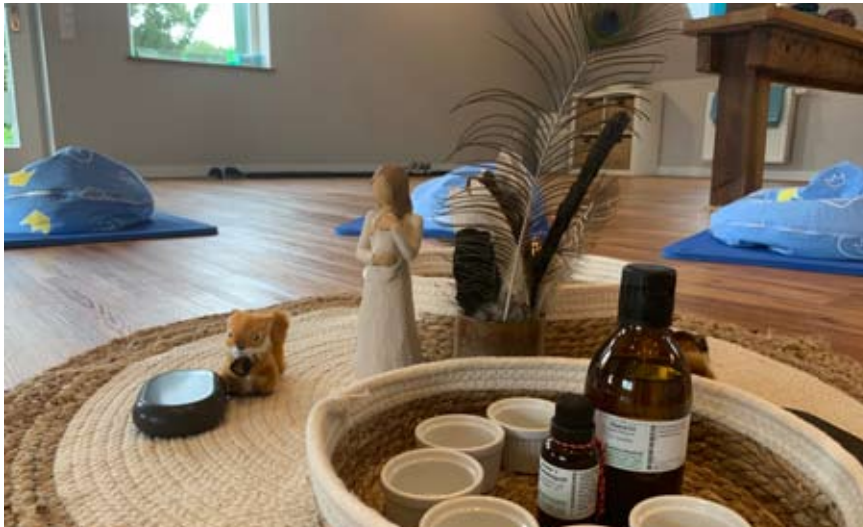
Entspannende Atmosphäre bei den Babykursen im Jugendhaus

MALIBU Eltern-Baby-Kurse 6-8 Babys mit ihren Müttern oder Vätern treffen sich wöchentlich in einer festen Gruppe. Die Kurse begleiten die Entwicklung der Babys während des ersten Lebensjahres und unterstützen Eltern im Umgang mit ihrem Baby. Es gibt Spiel- und Bewegungsanregungen, die die Entwicklung der Babys begleiten. Die Babys bekommen Kontakt zu Gleichaltrigen, denn sie kommunizieren bereits von Anfang an miteinander. Für Eltern ist es sehr spannend, die unterschiedlichen Entwicklungen der Babys zu beobachten und mit anderen Eltern im Austausch zu sein. Liebevoll kleine Spiele fördern die Beziehung zwischen Eltern und ihrem Kind und geben Anregungen für zu Hause mit. In der Kirchengemeinde Wildeshausen finden unsere Kurse im Jugendhaus neben der Alexanderkirche statt. Die gemütliche Atmosphäre des historischen Fachwerkhäuses lädt zum Wohlfühlen ein. Dieser Kurs umfasst 10 Vormittage je 90 Minuten, Kursbeitrag: 70 Euro. Kommende Termine: 30.09. bis 16.12. freitags, 10.45 bis 12.15 Uhr, Geburt: März bis Mai 2022. 24.11.2022 bis 23.02.2023, donnerstags, 10.45 bis 12.15 Uhr, Geburt: Juni bis August 2022