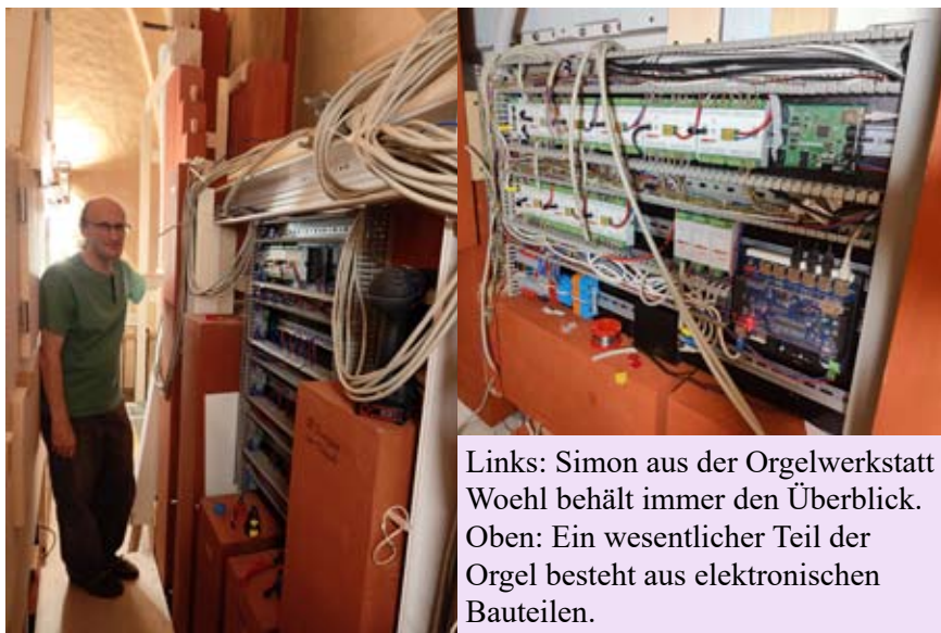
Links: Simon aus der Orgelwerkstatt Woehl behält immer den Überblick. Oben: Ein wesentlicher Teil der Orgel besteht aus elektronischen Bauteilen.

Einweihungskonzerte mit Orgel und Orchester um 15 und 18 Uhr (Siehe Seite der Kirchenmusik)