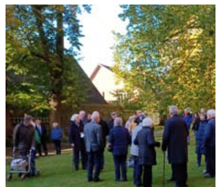
Aufstellen zum Fototermin...