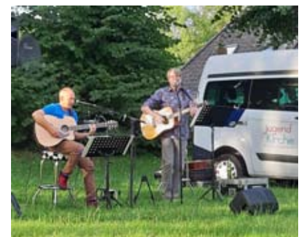
Only sing – Tour 2021