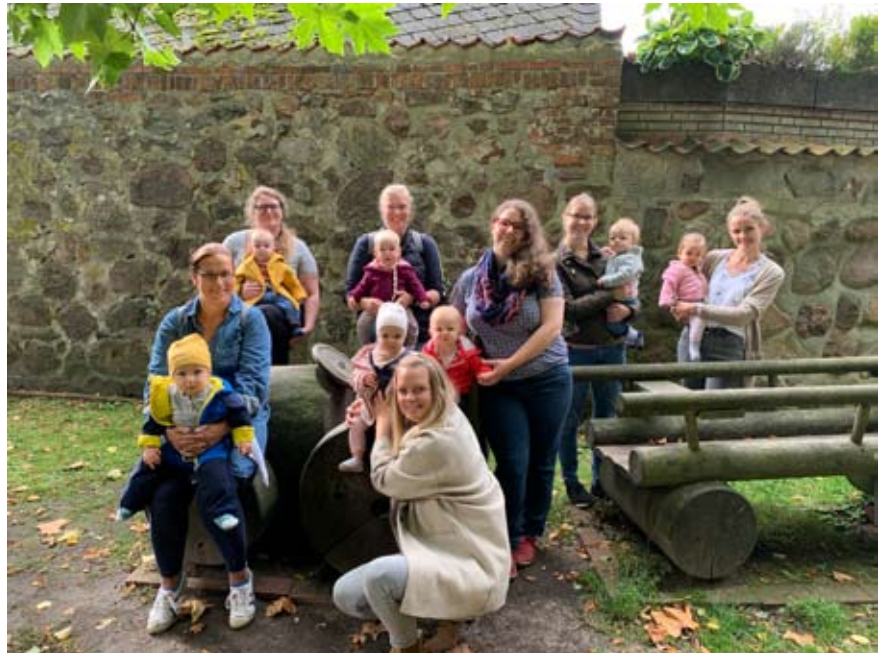
Nun sind sie schon ein Jahr alt: Die großen Krabbelzwerge! Hier sind sie alle mit ihren Mamas auf unserem Abschiedsfoto zu sehen.

Nun sind so viele Monate vergangen und unsere Eltern-Baby-Kurse konnten leider nicht alle wie gewohnt stattfinden. Die großen Krabbelzwerge mit unseren Oktober, November und Dezember 2020 geborenen Kindern haben nach den Herbstferien gemeinsam ihren ersten Geburtstag gefeiert. Eine bunte Stunde mit viel Musik und kleinen Geschenken. Wir haben uns nun fast ein ganzes Jahr getroffen und viele gemeinsame Stunden miteinander verbracht. Nun sind unsere gemeinsamen Eltern-Baby-Stunden zu Ende. Die kleinen Zwerge können alle bereits so viel: drehen, krabbeln und einige auch schon laufen. Mit ihren Händen greifen sie nach den Dingen dieser Welt. Wir Erwachsenen sollten das vielleicht auch mal wieder machen: „Immer und immer wieder das Gleiche üben, bis es endlich klappt“. Sie haben in den vergangenen Monaten so viel gelernt und werden schon bald mit ihren kleinen Füßen selbst ihre Wege gehen. „Ein Baby ist ein Engel, dessen Flügel schrumpfen, während die Beine wachsen.“