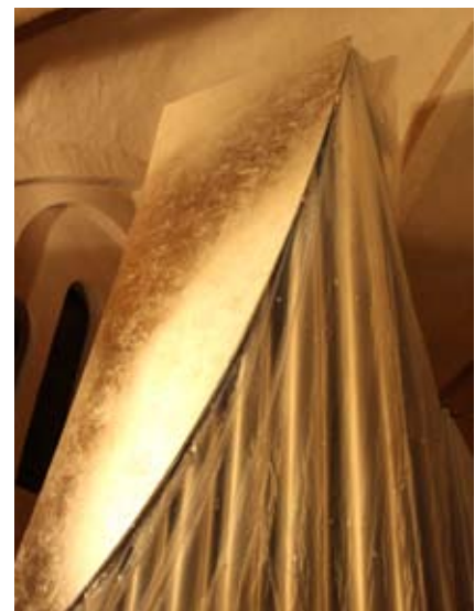
Das erste versilberte Gehäuseteil