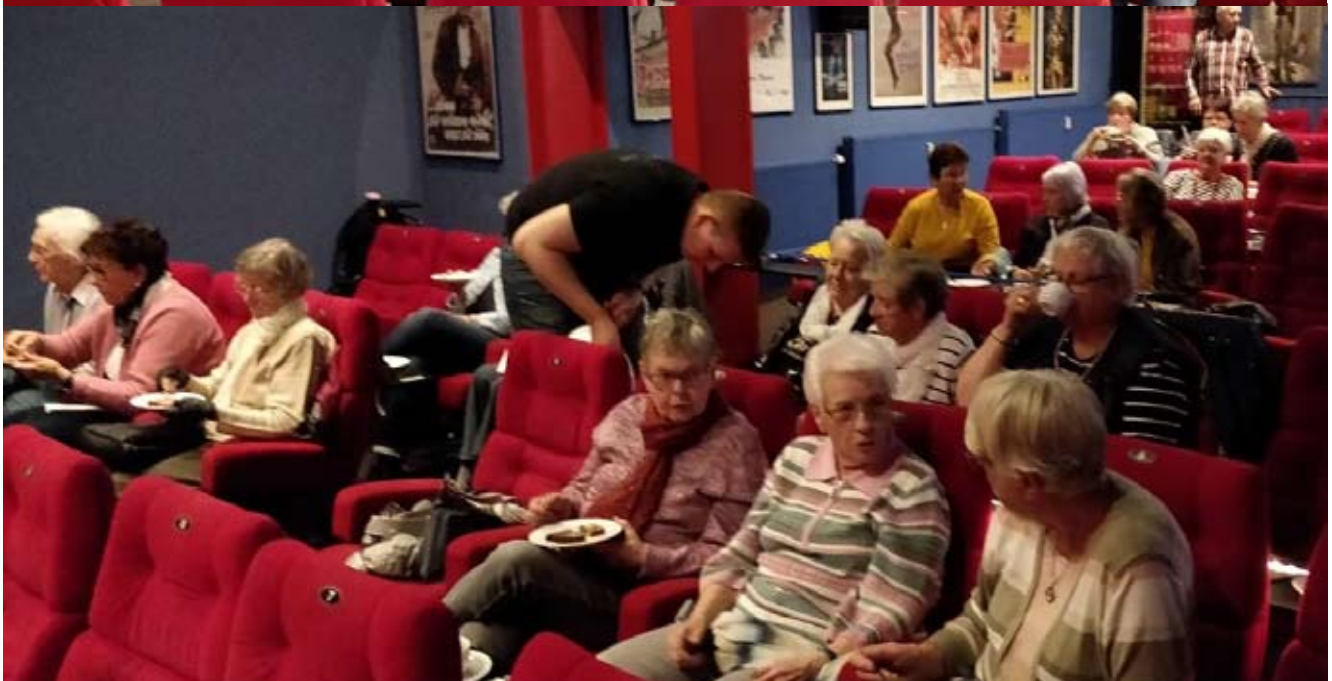
Die Vorfreude auf den Film „Enkel für Anfänger“ war deutlich zu spüren.