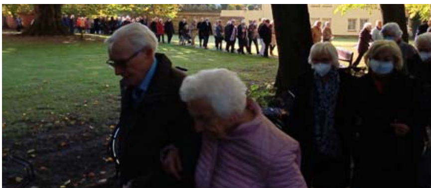
Ein langer, festlicher Zug vor stahlblauem Himmel