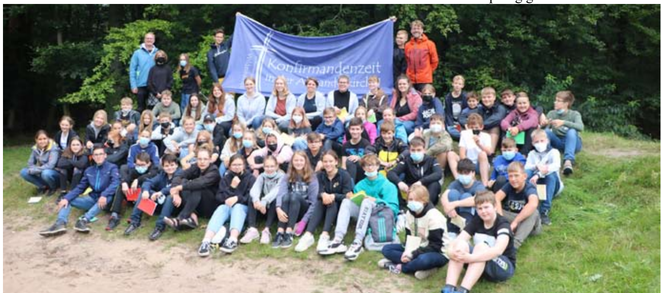
Nach der Einweisung macht das Klettern noch mehr Spaß (oben). Gruppenfoto von unterwegs (unten)

Da an diesem Wochenende im Verdener Dom Konfirmationen gefeiert wurden, war somit kein Platz mehr für die große Gruppe aus Wildeshausen. So ging es zu einer Gottesdiensttrudtour in die nähere Umgebung. An verschiedenen Stationen wurden gemeinsam Lieder gesungen und verschiedene Impulse von den K-Teamerinnen und den Pastoren gegeben. Unter den gegebenen Bedingungen eine sehr gute Lösung. Nach dem Mittagessen ging es auf die Rückfahrt und alle K22er konnten, wenn vielleicht auch müde, aber sichtlich froh und zufrieden, von den Eltern in Empfang genommen werden.