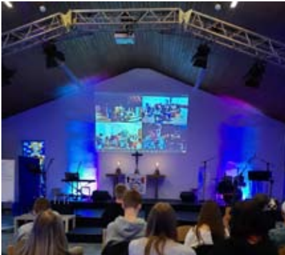
Gut vernetzt bei der Juleica – trotz mehrerer Schulungsorte

Wir sind sehr froh, dass diese Schulung so stattfinden konnte und möchten uns bei allen Beteiligten bedanken! Wir hoffen bald viele neue Teamer*innen in der ejo dabei zu haben und freuen uns