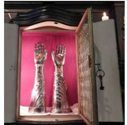
Die Reliquiare in Vechta

dem 20. Juni und am Sonntag, dem 21. Juni gezeigt.