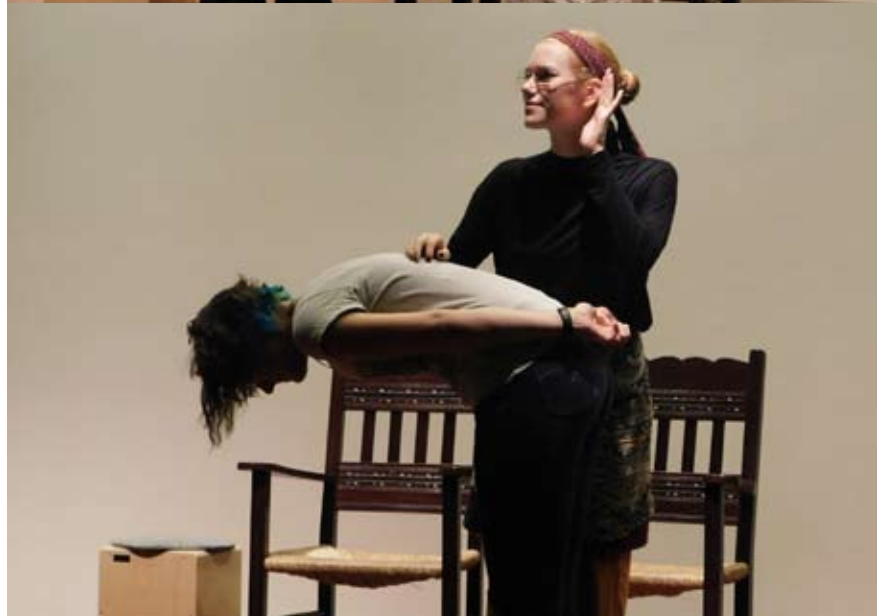
Ganz oben: Der mächtige König mit seiner ihm ergebenen Königin Oben: Die wunderhübsche Prinzessin lauscht am Fenster. Rechts: Mutig schwingt der Herzog sein Schwert.

Gemeinsam musizieren und singen, Gottesdienst feiern und sich mit anderen freuen – das ist es, warum wir uns immer wieder gerne auf den Weg machen. Und wenn wir uns auf die Reise nach Hertford machen, freuen wir uns auf die gemeinsame Zeit mit unseren englischen Freunden.