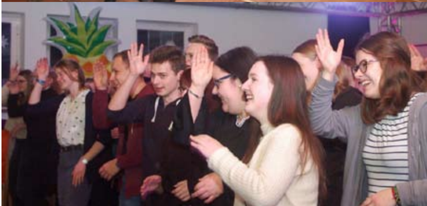
Oben: Alle sieben Szenen des Musicals wurden ausführlich dargestellt. Unten: Das Motto „Let’s have a party!“ wurde von den Ehrenamtlichen beim Empfang der Ehrenamtlichen voll ausgenutzt.