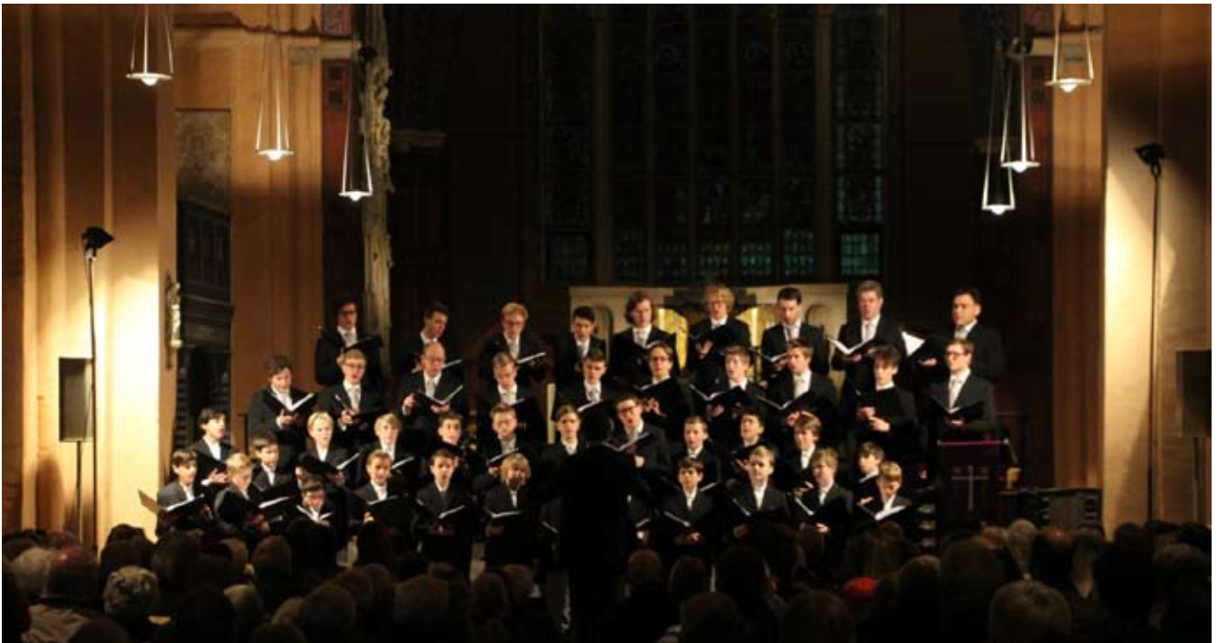
Der Knabenchor Hannover gab im Dezember ein weihnachtliches Konzert zugunsten des Orgelfördervereins. Es wurde finanziert von einem Hauptsponsor, der nicht genannt werden möchte. Wir bedanken uns bei ihm und bei allen anderen Sponsoren auf diesem Weg noch einmal ganz herzlich für dieses Engagement.