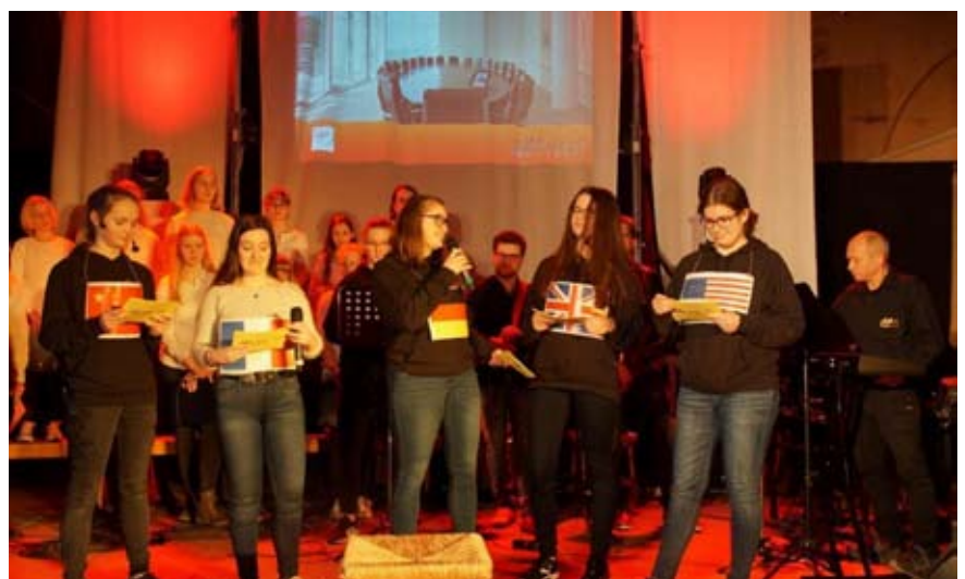
Die Klimakonferenz mit verschiedenen Staaten unter der Leitung Deutschlands wurde beim Alex18:30 im Januar dargestellt.