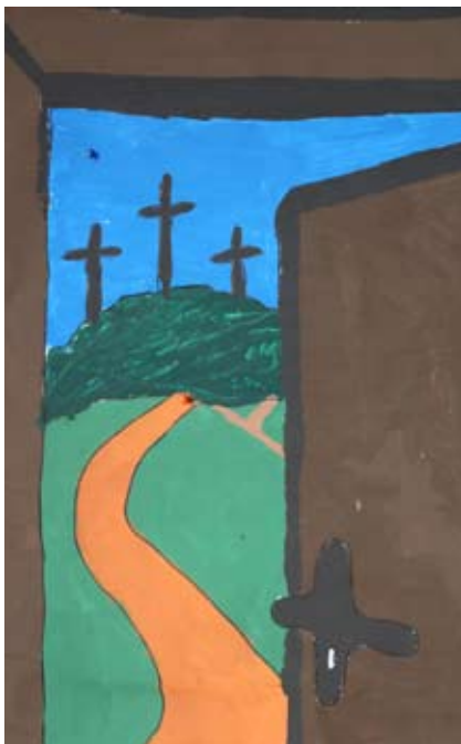
Oben: Der Blick durch die Tür... Rechts: Jesus im Garten Gethsemane.

Oster-Mini-Musical im Familiengottesdienst am Ostersonntag