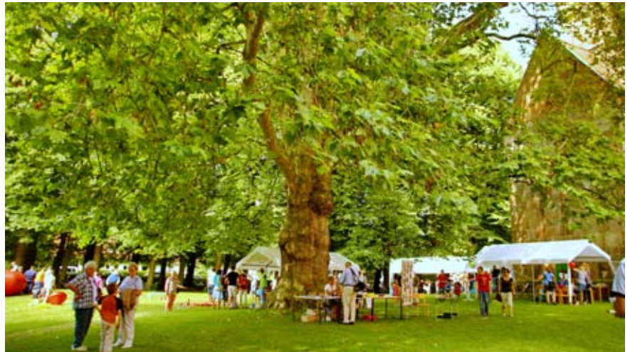
Im Juni herrscht wieder buntes Treiben um die Alexanderkirche.