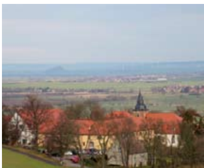
Aber auch der Blick über das Kloster ins Tal lädt zu Unternehmungen ein...