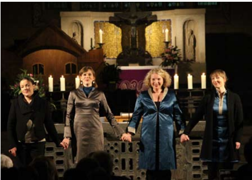
Das Vokal-Ensemble Niniwe aus Berlin begeisterte im Dezember die Zuhörer in der gut besuchten Alexanderkirche.

Wir freuen wir uns, dass wir mit all diesen Aktionen dem Ziel der Orgelerneuerung wieder ein Stück näher gekommen sind.