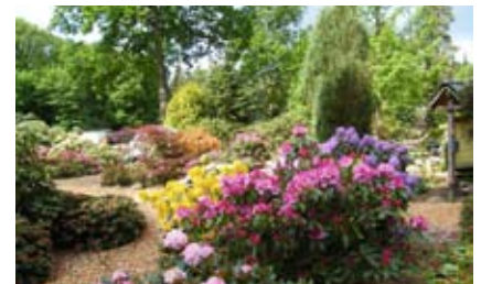
Walsrode - ein echter Hingucker!

Die Abfahrt ist am Bahnhof Wildeshausen um 13 Uhr, die Rückkehr gegen 18.30 Uhr. Der Teilnehmerbeitrag zur Fahrt wird im Bus eingesammelt. Bitte passend mitbringen! Anmeldeschluss ist Mittwoch, der 29. Mai.