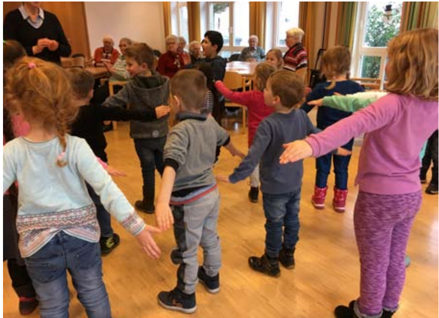
Tanz und Gesang im Alexanderstift. (Weitere Fotos auf Seite 32)

Mit viel Freude haben die Vorschulkinder den Bewohnern des Alexanderstiftes und den Tagesgästen der zugehörigen Tagespflege Wintergefühle ins Haus gebracht. Bei ihrem Besuch der Wohnbereiche sangen die Kinder Winterlieder, zeigten Fingerspiele und kleine Singspiele. Belohnt wurden sie mit Applaus, Gummibärchen und Getränken. Wir danken für diese schöne Erfahrung!