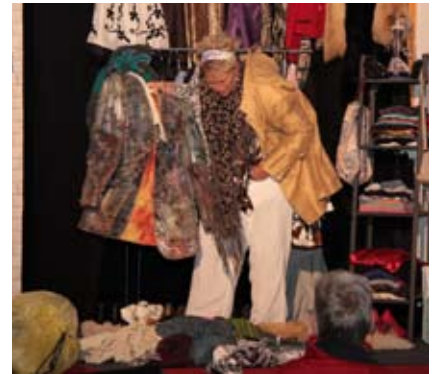
Braucht man wirklich so viel?

Cäcilienchule, Haarenufer 11, 26122 Oldenburg.