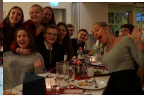
Oben und Mitte: Was Plastikmüll im Meer bedeutet, wurde beim Alex 18:30 deutlich gemacht. Unten links und rechts: Gute Stimmung und leckeres Essen gab es beim Empfang der Ehrenamtlichen.

Ausführliche Berichte zu diesen Aktionen stehen auf der Homepage: www.doll.ejo.de