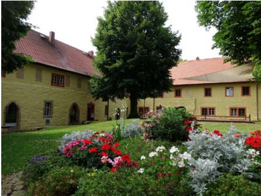
Ein stimmungsvoller Klostergarten lädt zum Verweilen ein...

Seniorenfahrt 2019, Frühstück und Termine