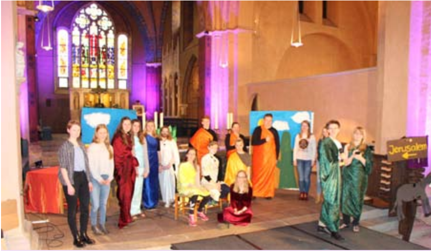
Gemeinschaftsprojekt von Konfirmanden, K-Teamern und dem Kinderchor - das Oster-Mini-Musical.

Fast schon ein Klassiker am Ostersonntag