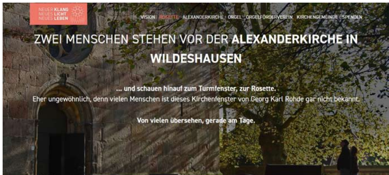
Ein Ausschnitt aus der neuen Homepage des Orgelfördervereins

IBAN: DE60 2802 0050 2804 2257 00, BIC: OLBODEH2XXX