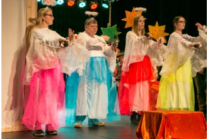
Schauspieler mit und ohne Behinderung brachten gemeinsam ein buntes, eindrucksvolles Stück auf die Bühne.

zu bringen. Nicht Behinderung oder Herkunft, sondern Eigen-Art und Persönlichkeit standen dabei im Rampenlicht. Gemeinsames Theaterspielen und Musizieren fördern ein tolerantes Miteinander, die Sensibilisierung füreinander und das Entdecken eigener Fähigkeiten. Ein herzliches Dankschön an alle, die dieses Projekt ermöglicht, unterstützt und sich auf vielfältige Weise eingebracht haben!