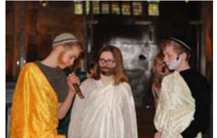
Die Emmausjünger mit Jesus auf dem Weg - eine Schlüsselszene.

In der Karwoche wird wieder geprobt und gewerkelt - und am Ostersonntag können Sie dann die Aufführung des neuen Oster-Mini-Musicals live im 10-Uhr-Gottesdienst miterleben!