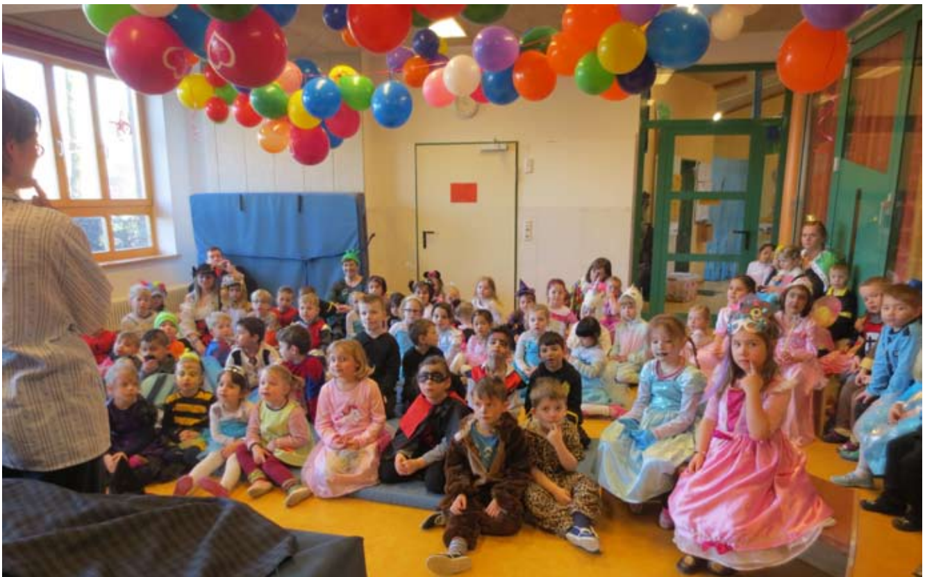
Alle Kinder lauschen gebannt der Geschichte von Poltergeist und Sonnenschein.