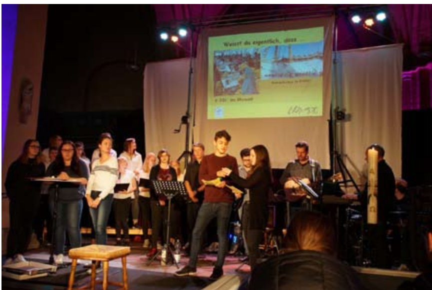
Teamgeist zeigt sich in den unterschiedlichsten Situationen.