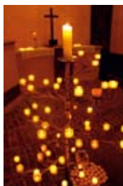
Der Lichterbaum im Südquerhaus der Alexanderkirche - beim Weihnachtsmarkt 2017

mit dem Gospelchor „Joyful Voices“ Leitung Ralf Grössler