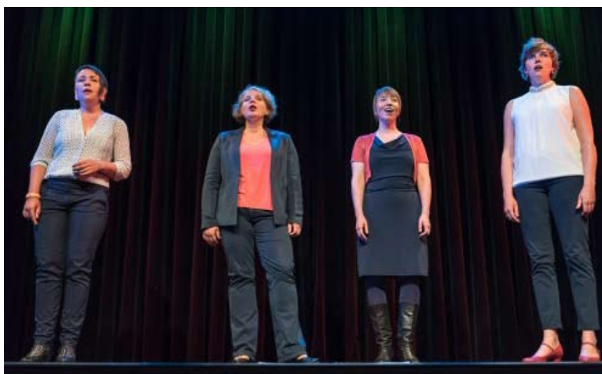
Die Gruppe Niniwe bei einem ihrer früheren Auftritte

Allen gemeinsam ist ein hoher Hör-Genuss und der Erlös für einen guten Zweck. Die Vorfreude steigt!