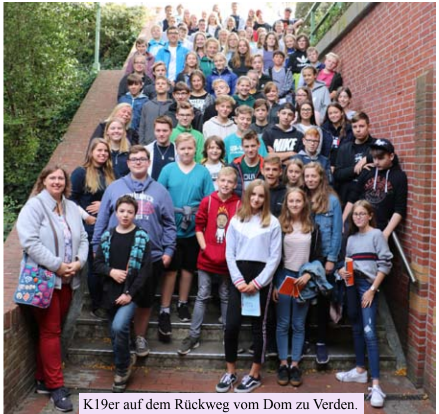
K19er auf dem Rückweg vom Dom zu Verden.