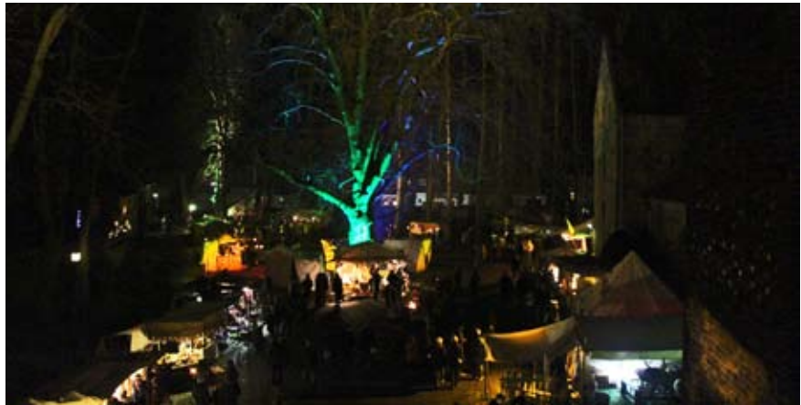
Auch die Farbenpracht der Lichter am dunklen Abend trägt zur besonderen Stimmung bei.

... verbreitet der Historische Weihnachtsmarkt in und um die Alexanderkirche. Inzwischen zum fünften Mal findet der Markt am dritten Adventswochenende statt. Als christliche Gemeinde versuchen wir dabei „Offene Kirche“ im besten Sinne zu leben. Es sind gute Gespräche, die im Eingangsbereich der Kirche bei Punsch und Keksen geführt werden. Der Eröffnungsgottesdienst am Freitag ist eine enge Zusammenarbeit zwischen Posaunenchor, Konfirmandenzeit, Kinderkirche und dem Pastorenteam. Ein besonderes Angebot sind die Bastelaktionen für Jung und Alt im Remter am Samstag und am Sonntag. Wer den Gospelchor hören und selber singen möchte,