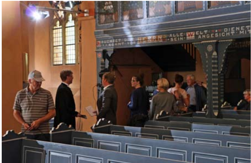
Ein kleiner Blick hinter die Kulissen der ZDF-Produktion. Die Sprecherinnen und Sprecher bekommen vom Tontechniker die Mikrofone angelegt.