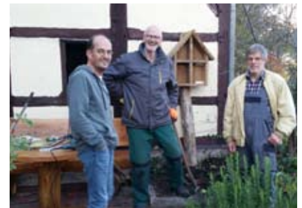
Nach getaner Arbeit...