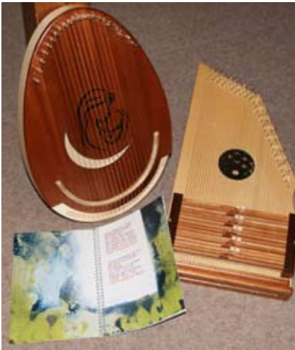
Traumleier und Autoharp

Die Singschule an der Alexanderkirche freut sich über zwei neue Instrumente, die über den Freundeskreis der Kirchenmusik angeschafft werden konnten.