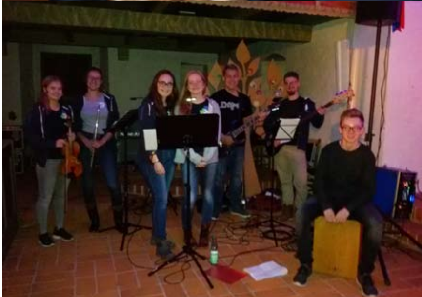
Oben und Mitte: Viel Spaß hatten die Teilnehmer/ innen der Juleica. Unten: Die Jugendband begleitet den C+C Jugendgottesdienst.

Ausführliche Berichte zu diesen Aktionen stehen auf der Homepage: www.doll.ejo.de