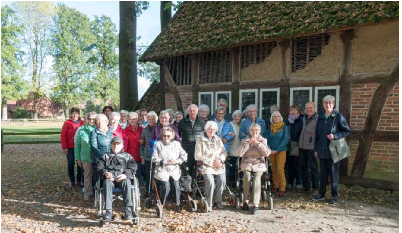
Sonnige Stimmung auf der Tagesfahrt nach Fischerhude.