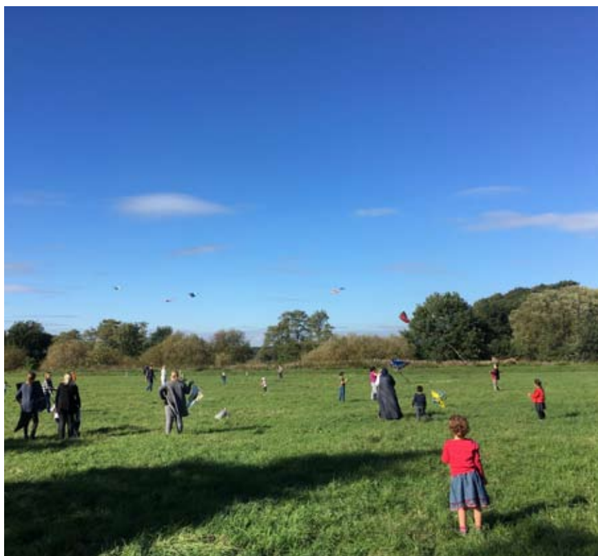
Das Herbstwetter meint es gut mit den Gruppenfesten! Eifrig stiegen die Drachen (oben), auch beim Picknick blieben alle trocken (unten).