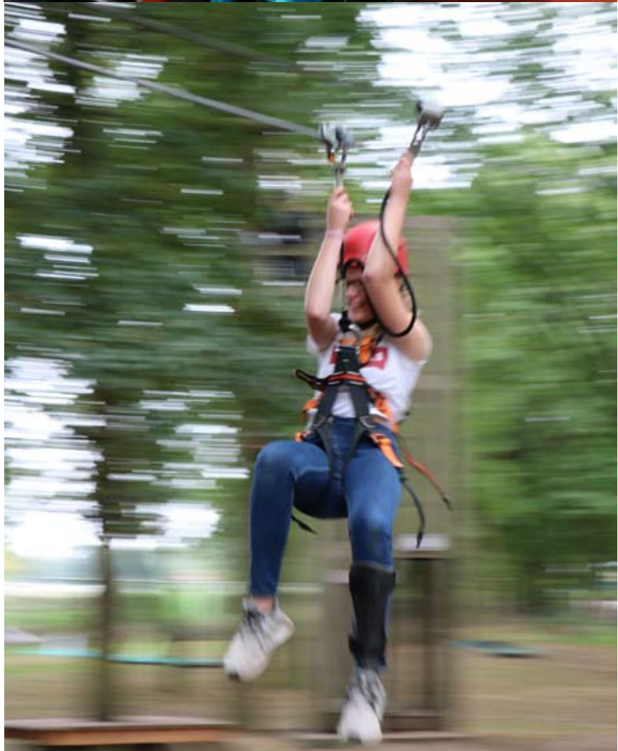
Die K19er füllten die Hälfte des einen Seitenschiffes im Dom (oben). Mit viel Schwung waren die K19er im Kletterpark mit dabei (unten).