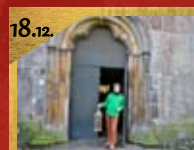
18.12. Taizé-Andacht Alexanderkirche Beginn 17:00 Uhr