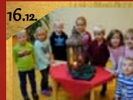
16.12. Weihnachtsandacht KiGa Schatzinsel, in der Alexanderkirche Beginn 10:00 Uhr