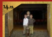
14.12. Adventsgottesdienst Gut Spasche, in der Alexanderkirche Beginn 08:15 Uhr