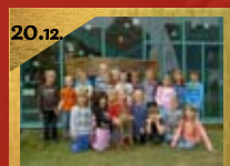
20.12. Weihnachtsfeier Holbeinschule, Holbeinstraße 1 Beginn 10:00 Uhr