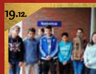
19.12. Adventliches Allerlei Hunteschule, Heemstraße 40 Beginn 10:00 Uhr