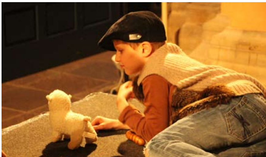
Vorbereitung des Weihnachtssingspieles in der Alexanderkirche.