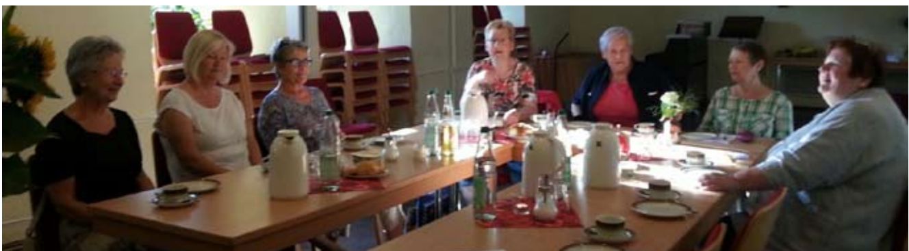
Das Vorbereitungsteam des Seniorenkreises (unten). Die Senioren bei der Feuerwehr (oben)

weise würden die Arbeitgeber in Wildeshausen gut kooperieren. Eine Atemschutzausbildung wurde beschrieben und dass die Ausrüstung nicht unbedingt einer Handtasche entsprechen würde. Zwanzig Kilo schwer sei die Ausrüstung und das Arbeiten unter Atemschutz sehr belastend. Gastarbeiter bei der Feuerwehr