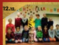
12.12. Adventliche Lieder und Gedichte St.-Peter-Schule, St.-Peter-Str. 3 Beginn 08:20 Uhr