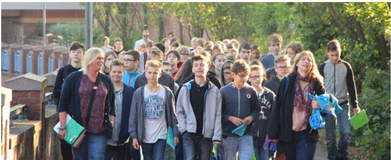
K17er auf dem Weg zum Dom in Verden (unten), beim Auftritt im Dom (oben) und mit Begeisterung (mitte).

Die vielen neuen Jungteamerinnen und -teamer, die in diesem Jahr noch nicht dabei waren, freuen sich nun umso mehr auf die große Fahrt zum Konfi-Camp nach Wittenberg im Juni 2017.