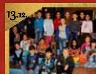
13.12. Weihnachtsbasar Wallschule, Im Hagen 4 Beginn 16:00 Uhr