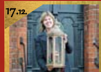
17.12. Kinderaktion auf dem Marktplatz Beginn 16:00 Uhr