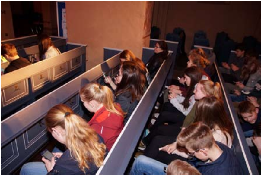
Bei der Abstimmung in diesem Gottesdienst durften die Jugendlichen ganz legal auf ihrem Handy tippen.