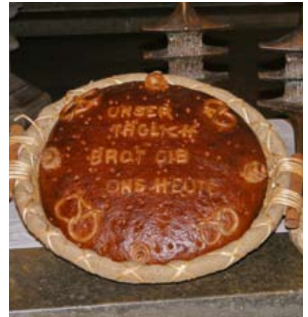
Die Brötchen beim Ferienpass werden sicher etwas kleiner, aber nicht weniger lecker sein.

Zeit für gute Beratung haben wir von 8 bis 20 Uhr. Jetzt Termin vereinbaren!