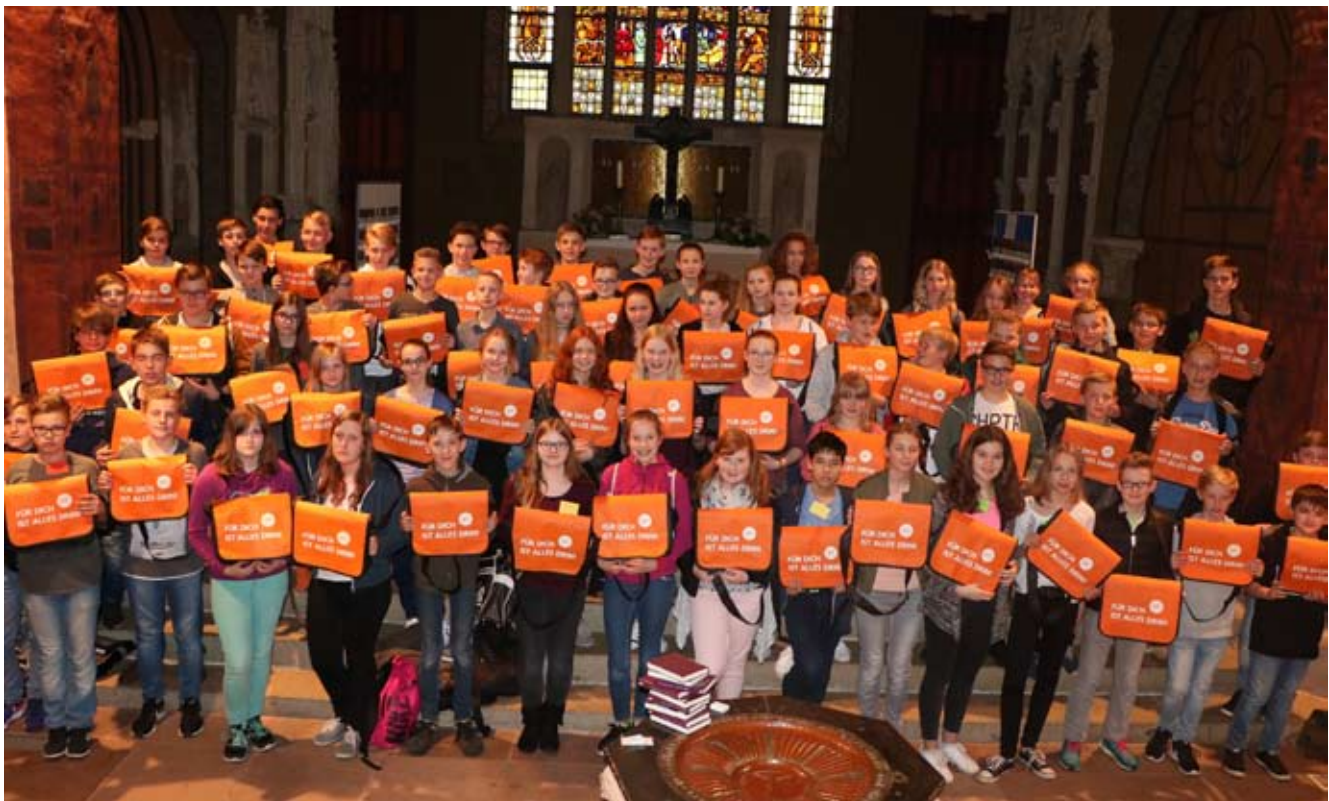
Der neue K18er-Jahrgang freut sich auf die Konfirmandenzeit und ist „reisefertig“!

Wir möchten auch in diesem Jahr wieder mit allen Jubiläumskonfirmanden einen schönen Tag verbringen und laden dazu alle recht herzlich ein. Die diesjährige Jubiläumskonfirmation mit einem Gottesdienst findet am 20. August 2017 statt. Eine schriftliche Einladung mit weiteren Informationen erhalten Sie von uns Ende Juni. Es wäre schön, wenn Sie unsere Kontaktdaten und den Termin an auswärtige ehemalige Konfirmanden weitergeben, damit auch Weggezogene eine Einladung von uns zu diesem festlichen Anlass erhalten. Vielleicht haben Sie ja noch mit dem einen oder anderen Kontakt. Wir freuen uns auf einen schönen Tag!