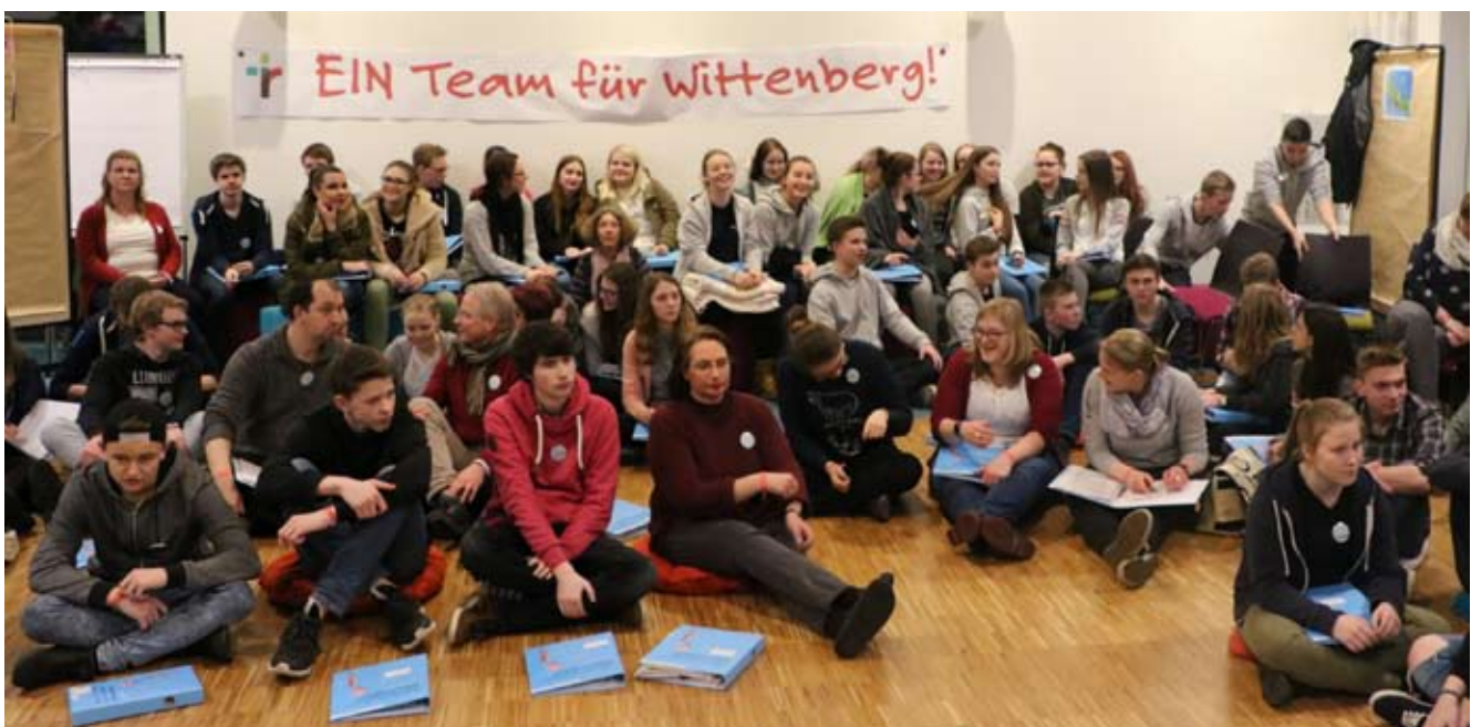
„Ein Team für Wittenberg“ – das Motto des Vorbereitungswochenendes und das K-Team mittendrin.

und Teamerinnen auch geistlich auf die kommende Zeit und die Aufgabe in Wittenberg vorbereiten sollte. Nach der Zeit in Ahlhorn sind nun alle sehr gespannt auf die Fahrt nach Wittenberg.