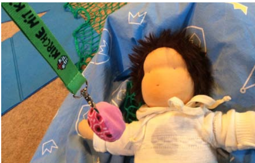
Zum Kuscheln für die „Kuschel- und Krabbelzwerge“