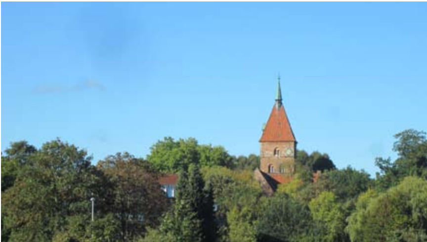
Die Alexanderkirche ist und bleibt eines der wichtigsten Wahrzeichen der Stadt Wildeshausen.

Der Tag des offenen Denkmals und „genuss am fluss“ ergänzen sich wieder.