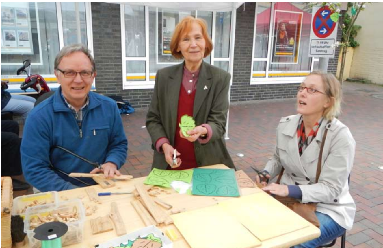
Am Stand des Ökumeneforums wurde auch kräftig Hand angelegt und gebastelt.

Davon waren etliche Besucher besonders berührt.