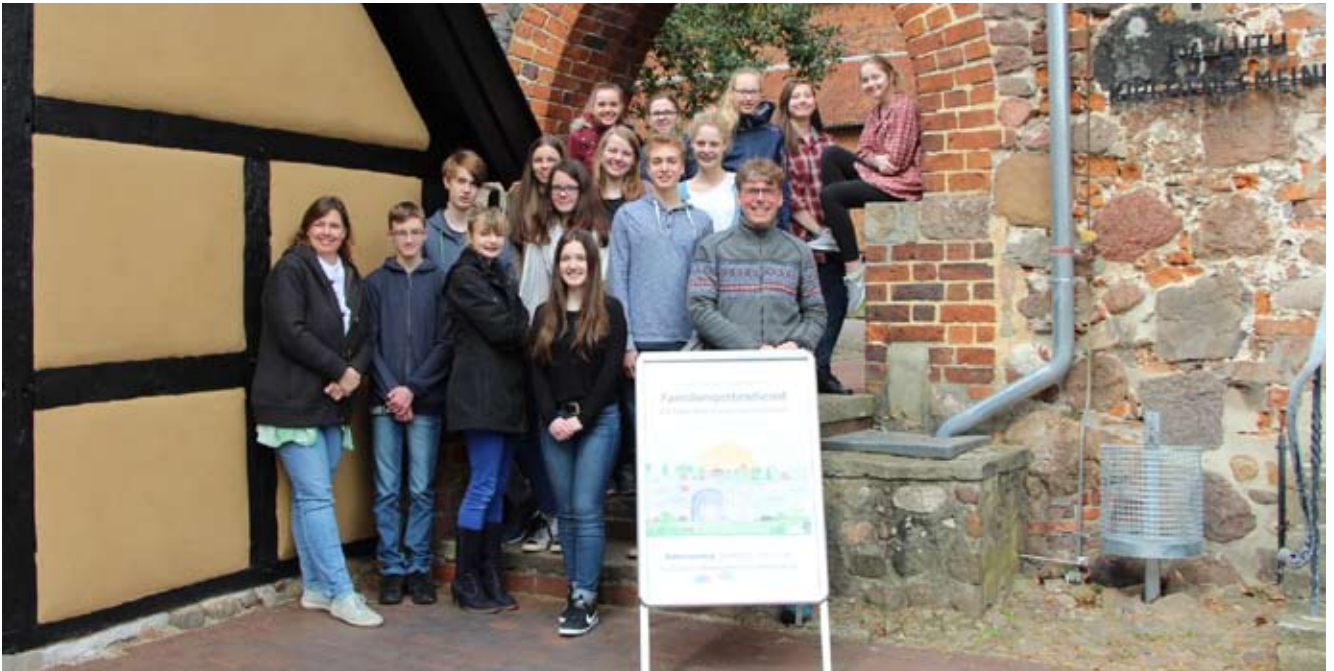
Das Team beim Start freut sich schon auf intensive Tage (oben). Das Kulissenteam ist kreativ (unten).

Impressionen vom diesjährigen Osterminimusal