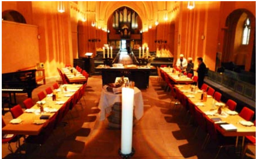
Die festlich geschmückte Tafel wartet auf die Besucher.

nächsten Jahr einen weiteren Gast mitbringt, werden die vier Tischreihen gerade reichen. Schöne Aussichten!