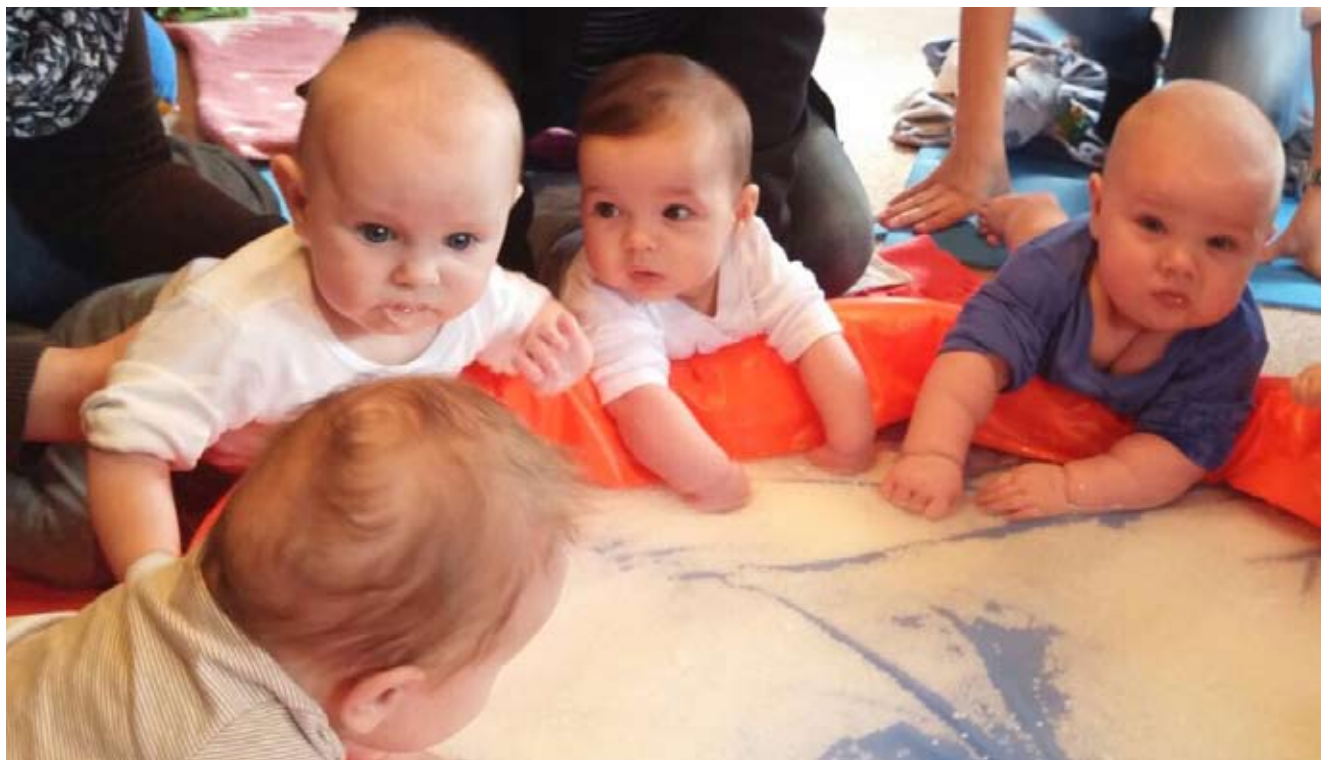
Fröhlicher „Austausch“ unter den Jüngsten in der Gemeinde.