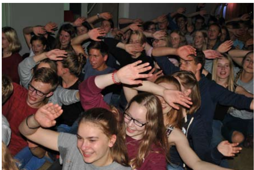
Viel Spaß hatten die Teilnehmer der JS im letzten Jahr.