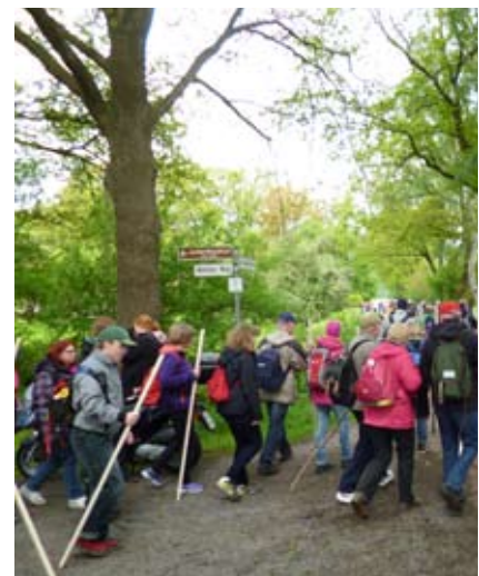
Alles Richtung Himmelsthür bitte!

Im Anschluss an den Gottesdienst ist ein Kirchenkaffee vorgesehen. Bei schlechtem Wetter steht der Festsaal im Haus Emsland zur Verfügung.