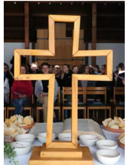
Alles vorbereitet zum Gottesdienst in der Blockhauskirche.

Doch das K-Team sollte nicht nur inhaltlich geschult und vorbereitet werden. Den krönenden Abschluss bildete ein Segens- und Entsendungsgottesdienst, der alle Teamer