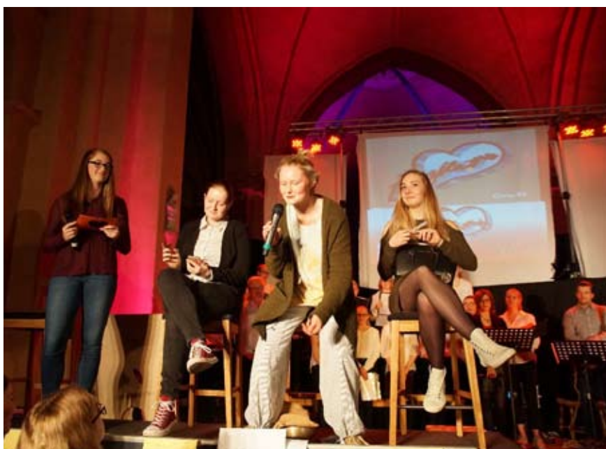
Für wen wird er sich entscheiden? – Mal das Publikum fragen!

Er konnte sich nicht entscheiden und so wurde das Publikum befragt, welche der drei Frauen am besten zu ihm passen könnte. Und das nicht mit Handzeichen, son-