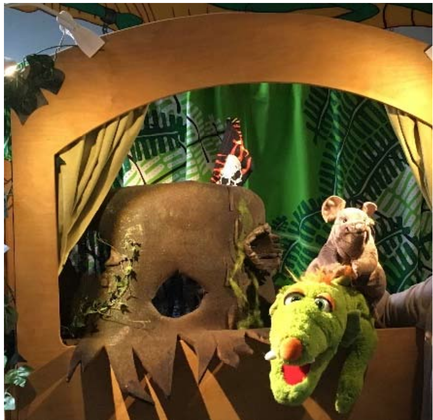
Gespannt schauen die Kinder der Schatzinsel auf die Maus und das Monster.