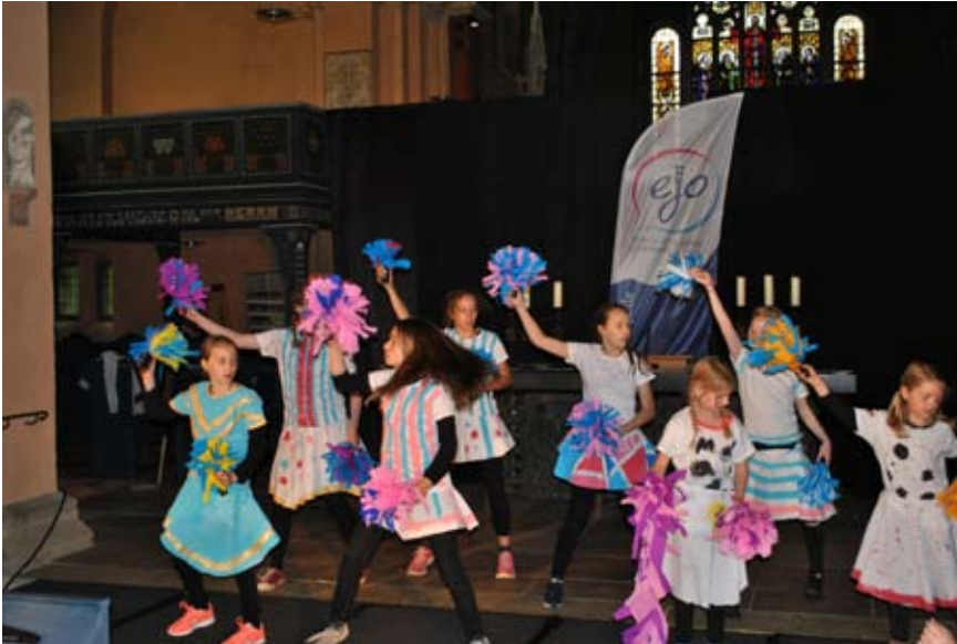
Abschlusspräsentation bei der Kinderferienwoche 2016

Sägekuhle 7, 27793 Wildeshausen, 04431/942979