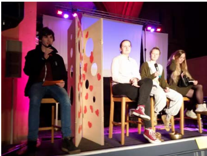
Beim Alex18:30 „Herzblatt“ wurde eine Castingshow nachgespielt.

So stellten sich Prof. Dr. Neubauer-Schmidt, Karrierefrau, die als Ausgleich meditativen Ausdruckstanz macht, Brigitte, die sich bei Greenpeace engagiert und Biotonnenhopping praktiziert und die schöne Isabella von Schnörkelstein, die auf ein perfektes Aussehen Wert legt, den Fragen des flippigen Jonas, der in den letzten Jahren in New York abgefahrene Gitarrenbeats entwickelt hat.