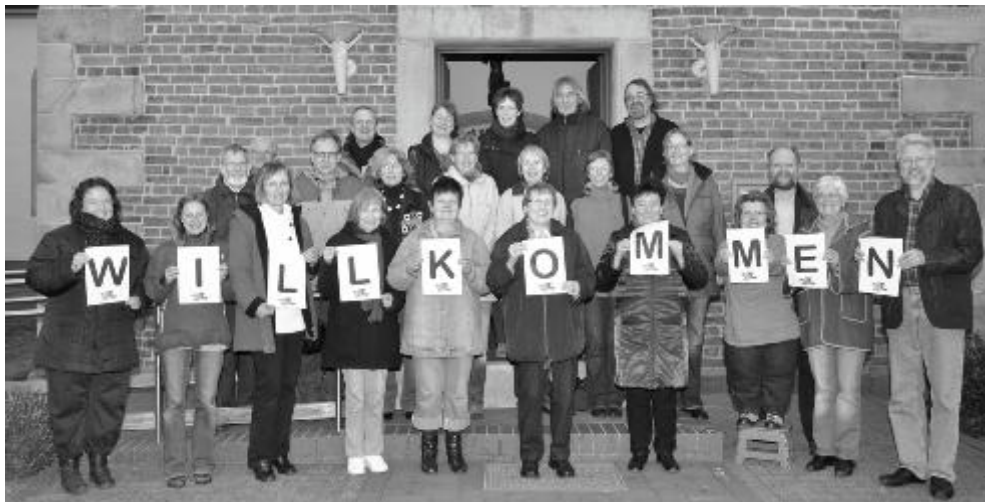
Die Mitglieder des Trägerkreises aus Wildeshäuser und Harpstedter Gemeinden laden herzlich zu dem Kurs ein.

40 ehrenamtliche Mitarbeiter und Pastoren der Alexandergemeinde, der