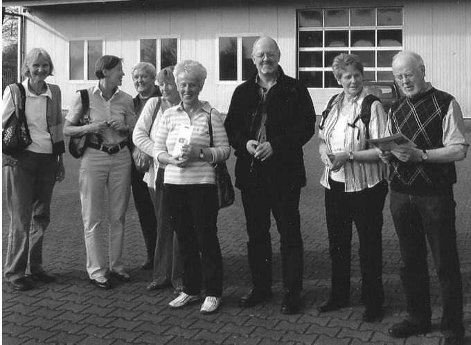
Besuchsdienstkreis - Besuch des Kompetenzzentrums Barrierefreies Wohnen (2008)