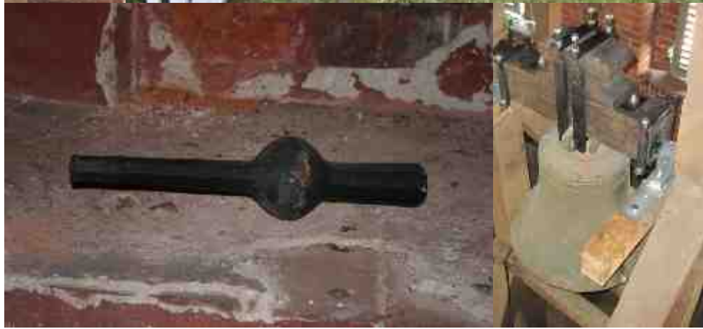
Erklärung zu den Bildern Seite 15