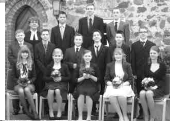
Konfirmation 21. April 2013