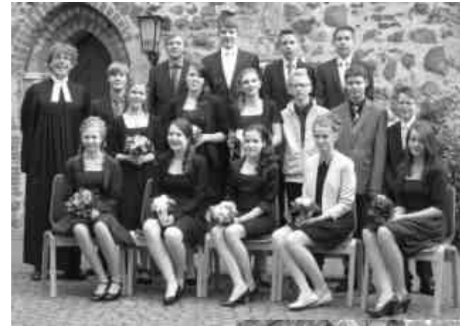
Konfirmation 20. April 2013