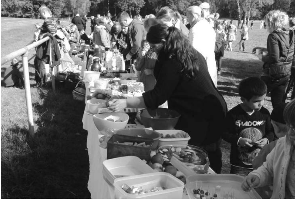
Lecker, lecker! Wenn man vom Hinter-dem-Drachen-herlaufen müde war, konnte man sich an dem reichhaltigen Buffet stärken.